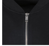
002 - Black