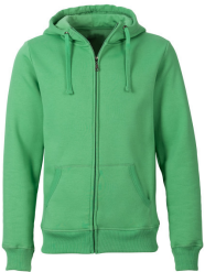
684 - Mid Green