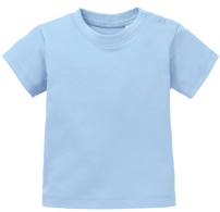
075 - Light Blue