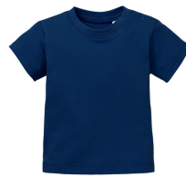
004 - Dark Blue