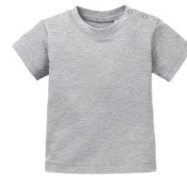
006 - Grey Melange