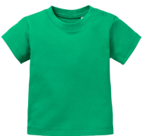
077 - Kelly Green