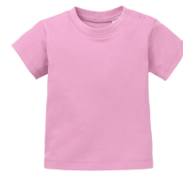
107 - Light Pink