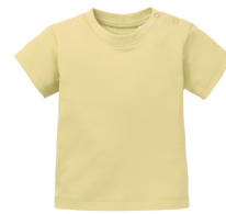
210 - Lemon