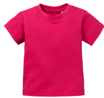
736 - Sorbet