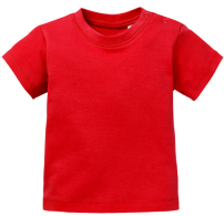
024 - Red