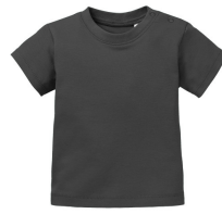
085 - Dark Grey