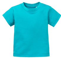
295 - Blue Atoll