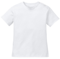
001 - White