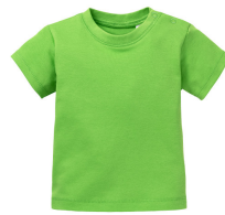
236 - Apple Green