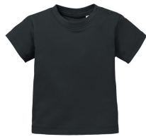
002 - Black