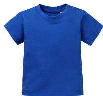
021 - Royal Blue