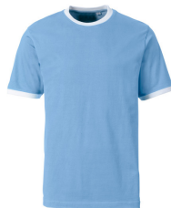
580 - Sky Blue / White