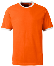
349 - Orange / White