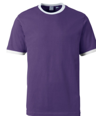
659 - Ultra Violet / White