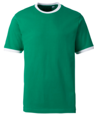
917 - Kelly Green / White