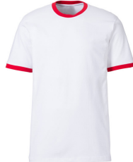
047 - White / Red