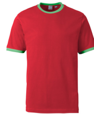
391 - Red / Green