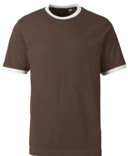
240 - Brown / White