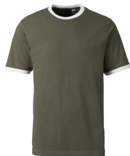
227 - Olive / White