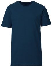
004 - Dark Blue