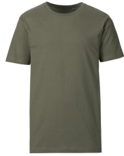
235 - Dusty Olive