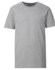
006 - Grey Melange