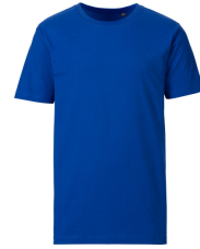
021 - Royal Blue