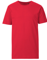
024 - Red