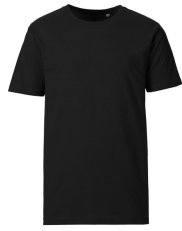
002 - Black