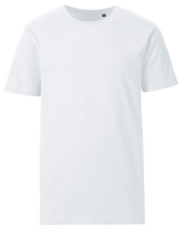
001 - White