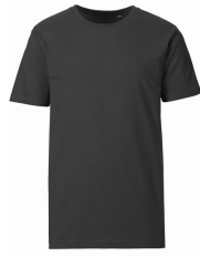
085 - Dark Grey