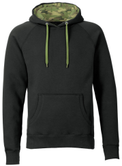
309 - Black / Wood Camo