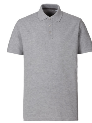
006 - Grey Melange