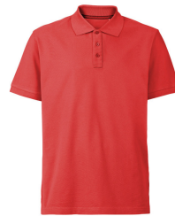
024 - Red