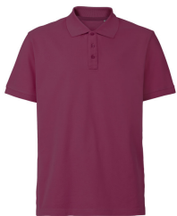
268 - Bordeaux