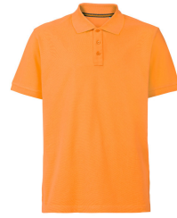
030 - Sun Orange