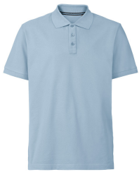
075 - Light Blue