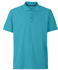
295 - Blue Atoll