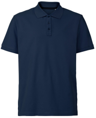
004 - Dark Blue