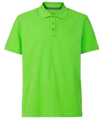
236 - Apple Green