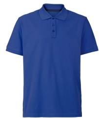
021 - Royal Blue