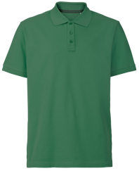
074 - Forest Green