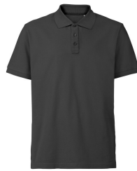
085 - Dark Grey