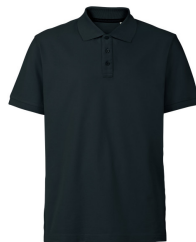
023 - Navy