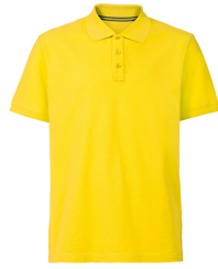
014 - Sun Yellow