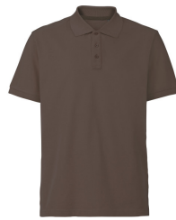
032 - Brown