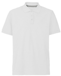
001 - White