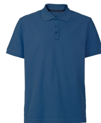
080 - Denim Blue