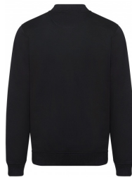
002 - Black