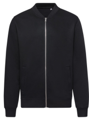
002 - Black