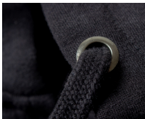
002 - Black