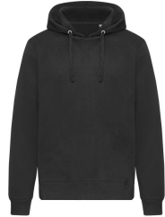
002 - Black