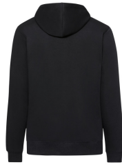
002 - Black