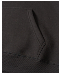
002 - Black