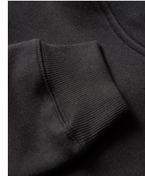
002 - Black