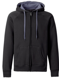
308 - Black / Grey Melange