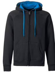
246 - Black / Strato Blue