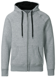
302 - Grey Melange / Black