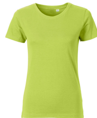
637 - Wild Lime