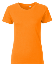
030 - Sun Orange