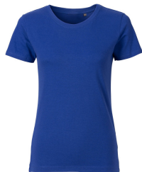
021 - Royal Blue