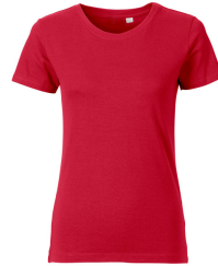
024 - Red