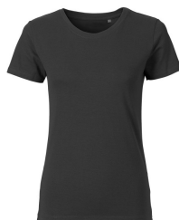
085 - Dark Grey