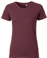
071 - Burgundy