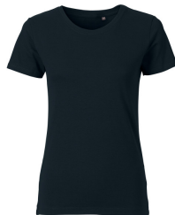
023 - Navy