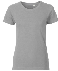
006 - Grey Melange