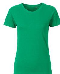
077 - Kelly Green