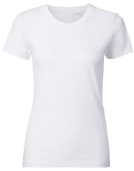
001 - White