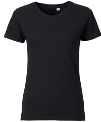
002 - Black