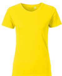
014 - Sun Yellow