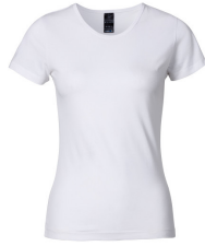
001 - White