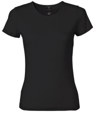
002 - Black