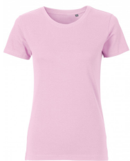
107 - Light Pink