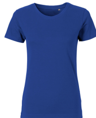
021 - Royal Blue