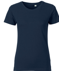
004 - Dark Blue