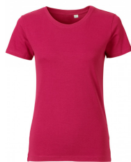
736 - Sorbet