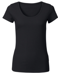
002 - Black