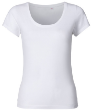
001 - White

Packungsinhalt: 5 Kartoninhalt: 50 Ursprungsland: Bangladesch Zolltarif-Nr.: 61091000