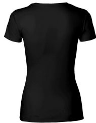
002 - Black