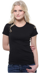
002 - Black