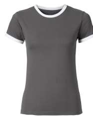
835 - Dark Grey / White