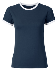
042 - Navy / White