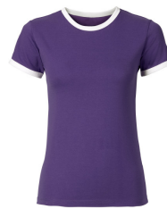
659 - Ultra Violet / White