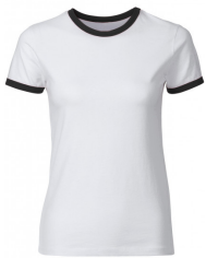
063 - White / Black