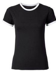
066 - Black / White