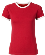
068 - Red / White