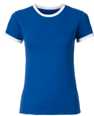
065 - Royal / White