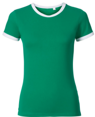
917 - Kelly Green / White