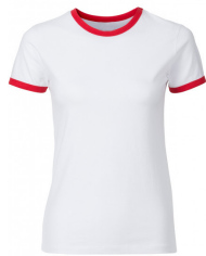
047 - White / Red