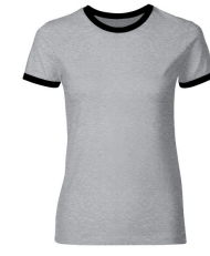
302 - Grey Melange / Black