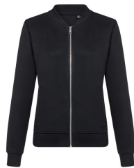
002 - Black