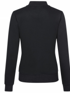
002 - Black