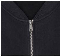
002 - Black