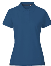
080 - Denim Blue