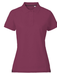
268 - Bordeaux