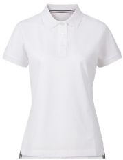
001 - White