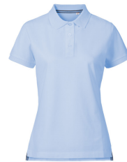
075 - Sky Blue