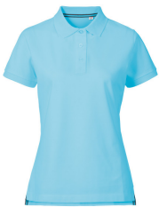
295 - Blue Atoll