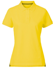
014 - Sun Yellow