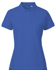
021 - Royal Blue