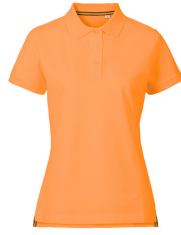
030 - Sun Orange