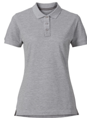
006 - Grey Melange