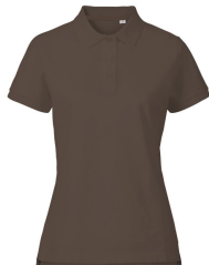
032 - Brown