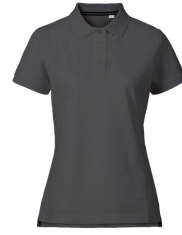
085 - Dark Grey