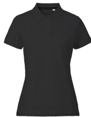
002 - Black