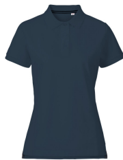
023 - Navy