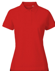
024 - Red