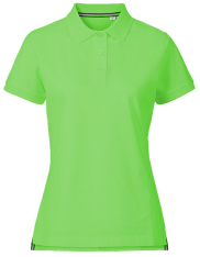
236 - Apple Green