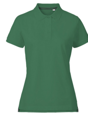
074 - Forest Green