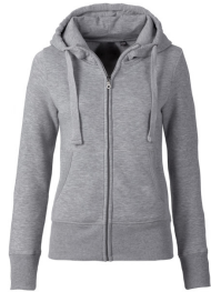
006 - Grey Melange