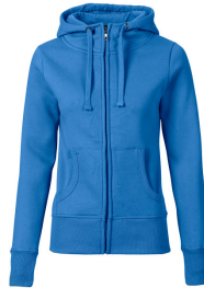
079 - Azure