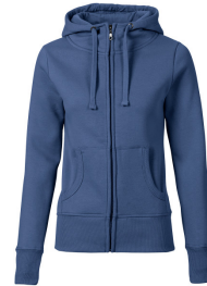
080 - Denim Blue