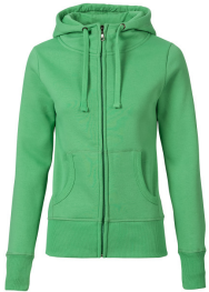
684 - Mid Green